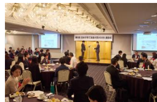
第6回日本子育て支援大賞 表彰式の様子